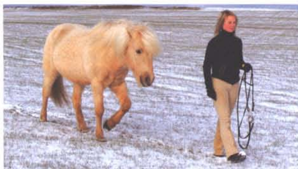
Sanngjarn leiðtogi - sátttur hestur

Traust og velliðan eru grundvallaratriði þess að hægt sé að hafa jákvætt og árangursríkt samstarf við hestinn.